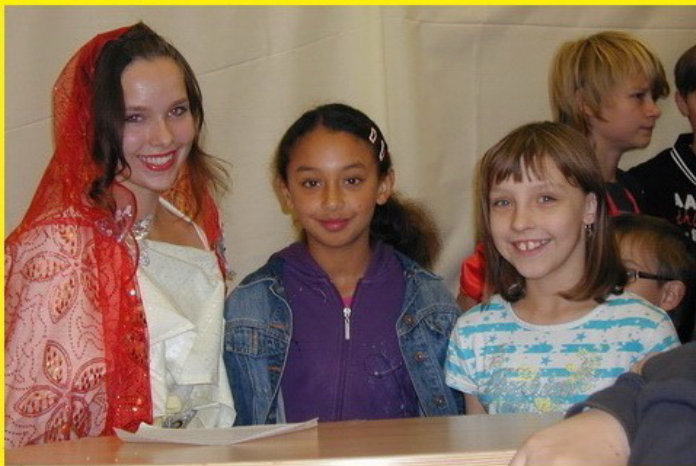
Sieger im Römer-Wettbewerb

Ein bereits im letzten Schuljahr ausgeschriebener Wettbewerb zum Thema "Aus der Welt der Römer" richtete sich an Duisburger Grundschulern. Es gab Buch- und DVD-Preise zu gewinnen!