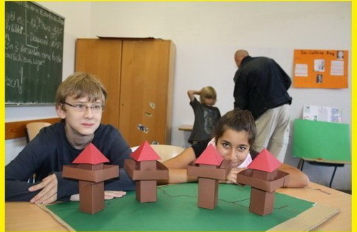
Wachtürme am Limes