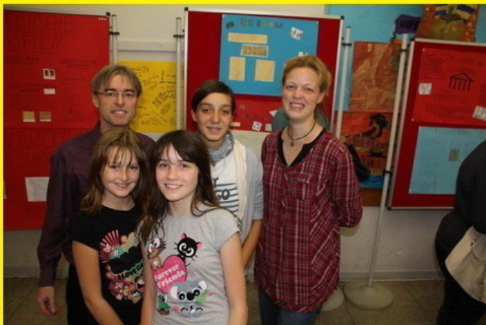
Discipulae et magistri