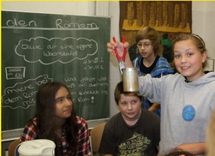
Wachs schmelzen für römische Schreiftafeln