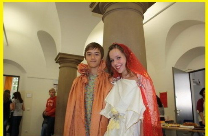
Hermes und Aphrodite erschienen persönlich