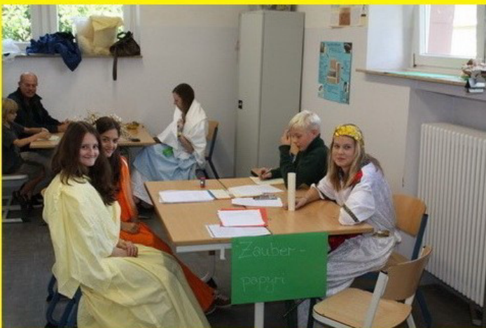
Garantiert wirksame Zauberpyri schreiben