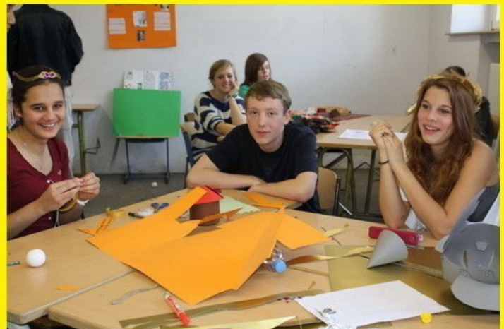
Römische Panzer und Helme werden gebastelt